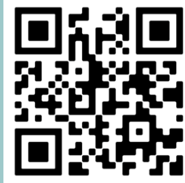
Escanee para ver más información del MCRT