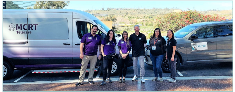
Providers of the County's Mobile Crisis Response Team

The Mobile Crisis Response Team (MCRT) program offers 24/7 mobile support to people experiencing a mental health or substance use-related crisis where they are, when they need it.