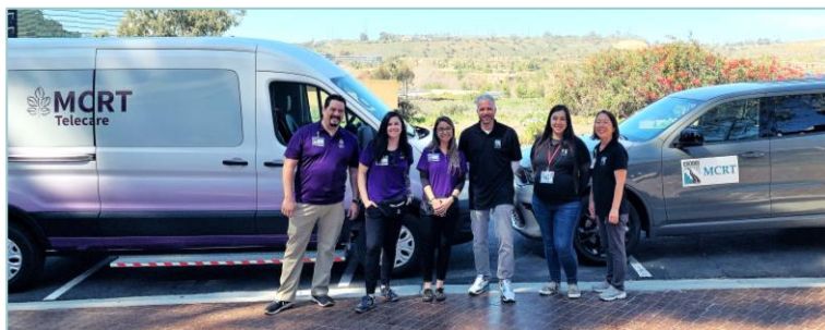
Proveedores del Equipo Móvil de Respuesta a Crisis del Condado

Sirve a todo el condado y personas de todas las edades. El MCRT es una alternativa a la respuesta policial. Incluye expertos en salud conductual, capacitados para responder en la comunidad y reducir las crisis relacionadas con alcohol, drogas o salud mental.